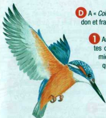
MARTIN-PÊCHEUR / DESSIN P.R.

Appréciez les multiples saveurs d'un pays accueillant : la combe ombragée d'une ripisylve verdoyante, le recueillement d'un sanctuaire médiéval, les cultures du plateau et la garrigue !