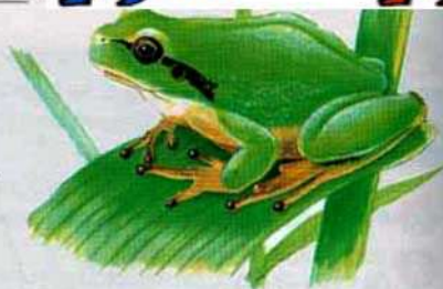
RAINETTE MÉRIDIONALE / DESSIN PR.

ne le confondez pas avec le hibou petit-duc dont le chant est le même que notre crapaud.